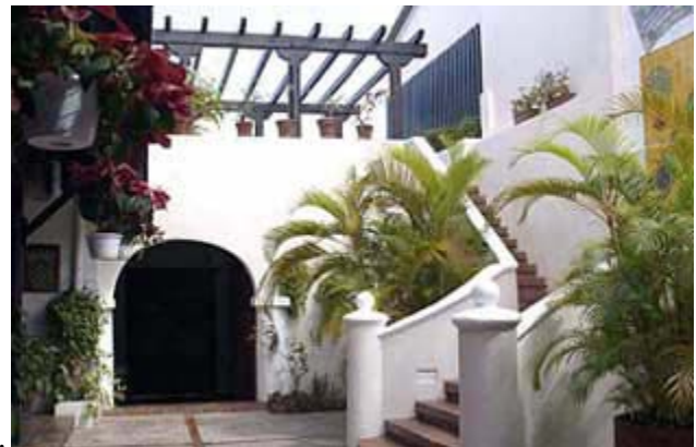
Museo Casa Alonso, Vega Baja. Lugar de nacimiento de la familia Otero-Salgado, donde se filmó la película Linda Sara .